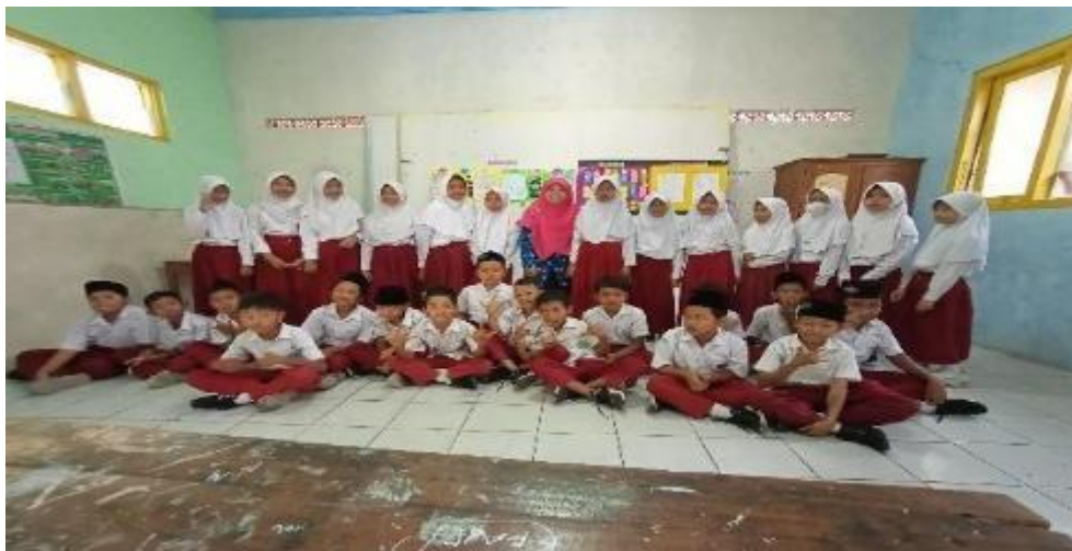
Gambar 1. peserta pelatihan menulis arab

Kegiatan pengabdian dalam pelatihan menulis arab menggunakan media kartu bergambar ini melibatkan 32 siswa kelas IV dan kelas V sebagai peserta. Pelatihan ini dilaksanakan selama 2 hari yang mencakup observasi dan wawancara kepada guru dan kepala sekolah sebagai mitra pendamping pengabdian. Berdasarkan hasil observasi dan wawancara pra pelatihan terkait dengan menulis arab bahwa kemampuan mayoritas siswa belum menguasai kaidah penulisan arab yang benar, baik membentuk huruf, menyambung huruf atau membuat kalimat sederhana. Pembelajaran menulis menjadi kurang menyenangkan karena penyampaiannya kepada siswa kurang difahami oleh siswa sendiri, bahkan materi menulis menjadi pelajaran yang tidak menyenangkan.