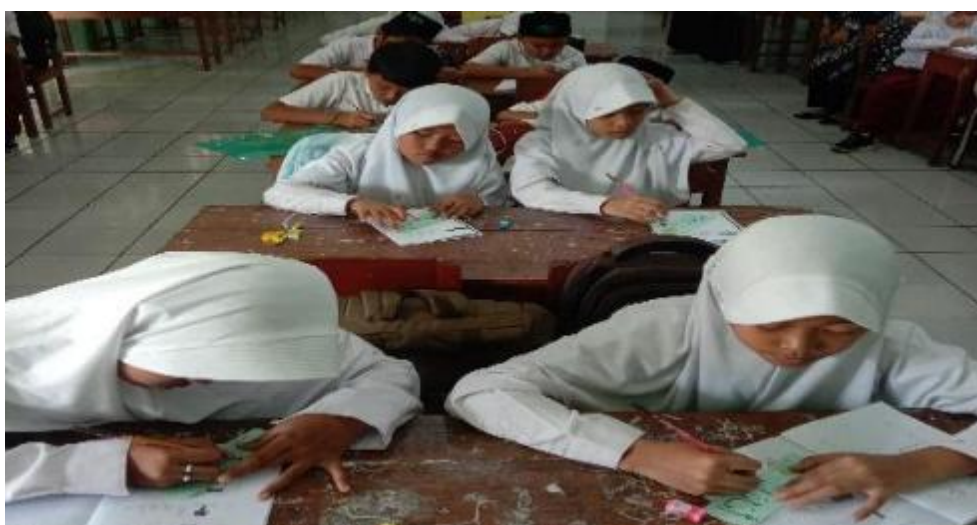
Gambar 2. Siswa Praktik Menulis Huruf Hijaiyah

Pelatihan menulis Arab diawali dengan penyampaian materi yang telah disampaikan dalam modul menulis Arab. Adapun praktik menulis hijaiyah dilakukan dengan cara menebalkan dan mencontoh huruf hijaiyah dengan pola penulisan huruf arab yang berdiri sendiri, menulis huruf di depan, di tengah dan di akhir yang dilakukan oleh masing-masing siswa dengan bimbingan pembantu pengabdian.