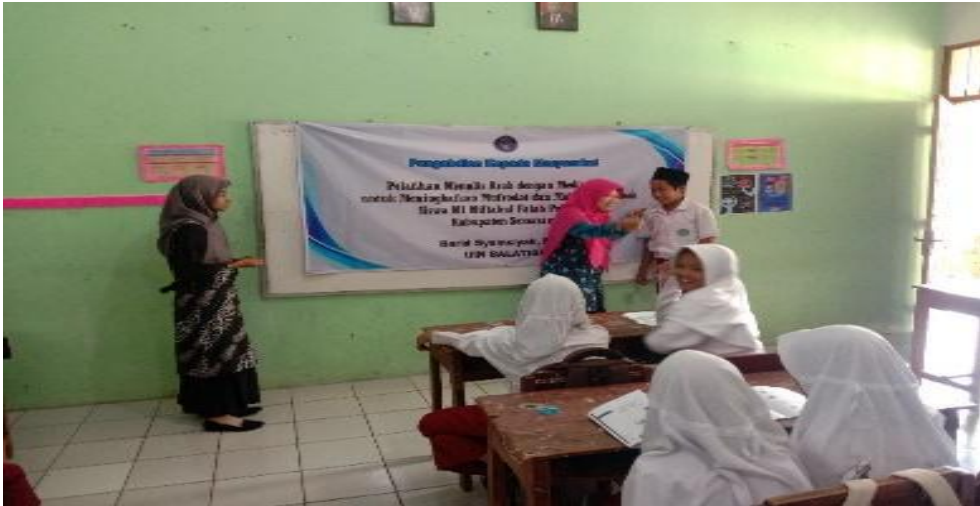
Gambar 3. Siswa Menebak Kosakata Dalam Bahasa Arab

Menebak gambar adalah permainan yang dilakukan dengan cara memberikan pertanyaan kepada siswa kemudian siswa menjawab dengan kata dalam Bahasa Arab. Dalam praktek menebak gambar ini siswa disajikan dengan beberapa pertanyaan kemudian siswa menjawab dengan mencari kosakata dalam kartu bergambar.