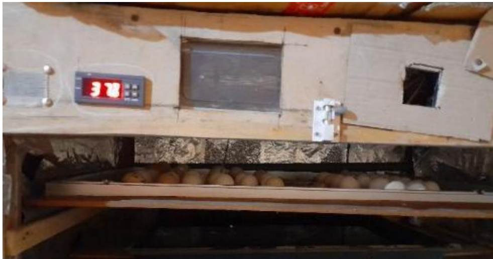
Gambar 2. Pengoperasian Mesin Tetes