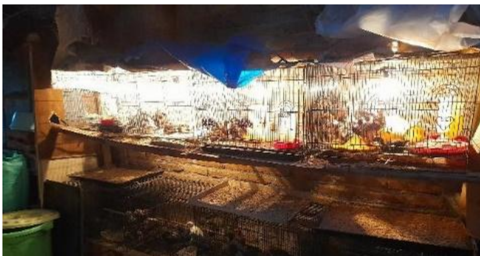
Gambar 3. Perbaikan Manajemen DOC umur 1-30

Pemberian kandang untuk DOC usia kurang dari 30 hari, Kandang yang dipilih adalah kandang besi untuk kucing/burung dengan ukuran 60x40x40, digunakan model ini karena lebih tahan lama dan anti dengan predator DOC seperti (musang, tikus, ular, burung, dll). Pendampingan pemeliharaan brooding, dilakukan untuk menekan mortalitas anak ayam dengan cara anak ayam dipelihara secara terkurung dalam kandang indukan selama 30 hari. Pakan yang diberikan berupa BR-1 dan diberi pemanas lampu pijar atau lampu kuning hangat ukuran 5 Watt. Hasil pendampingan sudah ada 2 mitra yang telah menerapkan model anak yang terpisah dengan Indukan.