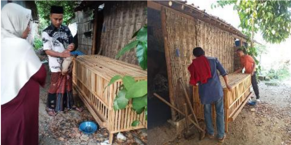
Gambar 4. Pemberian kandang DOC umur lebih dari 30 hari

Pemberian kandang untuk anak ayam umur lebih dari 30 hari, digunakan kandang dengan bahan kayu jati dengan ukuran panjang 2 m, lebar 70 cm, tinggi 80 cm. Kandang ini dipilih karena kualitas bahan yang pasti tahan lama dan kapasitas dapat menampung 40 ekor ayam. Pemberian kandang ini dilakukan pada hari sabtu, 16 September 2023 pukul 09.00. Hasil pendampingan sudah ada 2 peserta yang telah menerapkan model brooding anakan di dalam kandang ini.