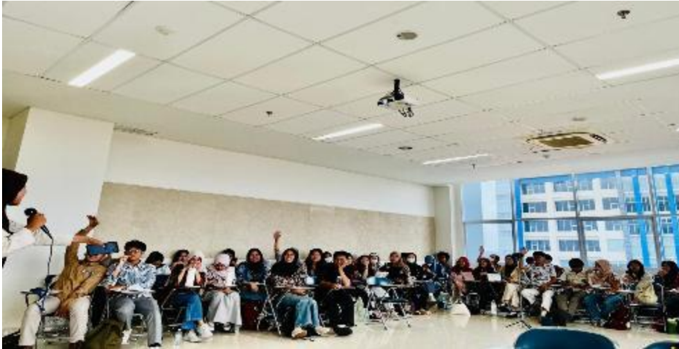
Gambar 4. Peserta Menyampaikan Hasil Menulis Makalah

disesuaikan tema presentasi bidang keilmuan masing-masing peserta sehingga hasilnya efektif. Pelatihan tidak hanya berdasar pada teori dan penjelasan di kelas namun eksplorasi terkait objek di kehidupan nyata juga penting dan menarik untuk disampaikan. Arwen et al. (2025) memperkuat data bahwa pembelajaran berbasis pengalaman telah terbukti efektif membantu mahasiswa mendapatkan pengalaman langsung dalam menyelesaikan tantangan nyata yang pada akhirnya dapat meningkatkan kesiapan mereka dalam menghadapi dunia kerja.