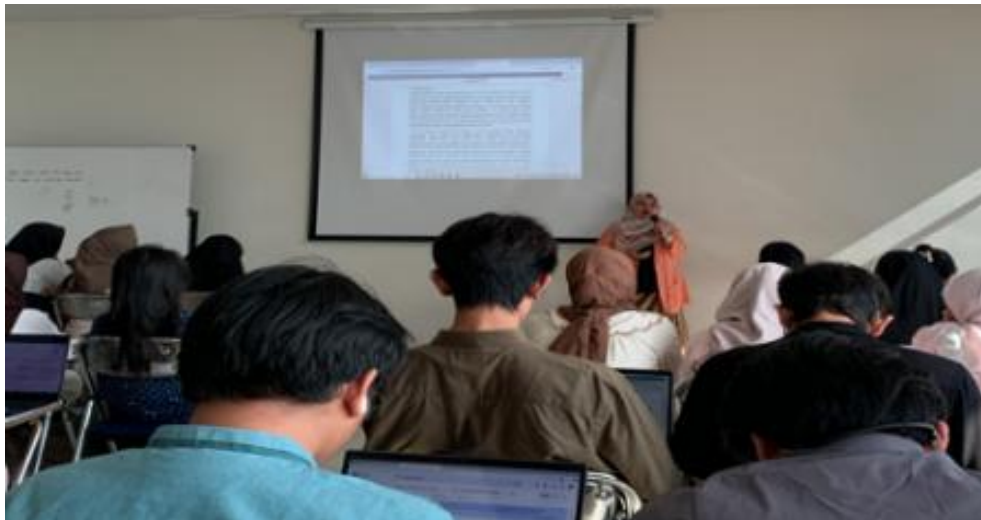
Gambar 2. Pelatihan Literasi Menulis Makalah di Universitas Airlangga.

Berbasis Studi Lapangan di Kawasan Enam Tempat Ibadah Surabaya Barat.” Judul tersebut kemudian diperbaiki menjadi “Bhinneka Tunggal Ika Berbasis Studi Lapangan di Kawasan Enam Tempat Ibadah Surabaya Barat.” Frasa dalam kehidupan nyata tidak perlu disertakan karena kegiatan studi lapangan sudah menunjukkan representasi nyata dari objek yang dikaji. Temuan ini menunjukkan bahwa kelengkapan struktur paragraf, termasuk ketepatan judul, berperan penting dalam membantu mahasiswa menyusun tulisan yang jelas, efektif, dan representatif. Hanifah (2023) menegaskan bahwa ketepatan perubahan makna dapat memengaruhi efektivitas gagasan, pesan, informasi, dan isi tulisan agar sampai kepada pembaca. Oleh karena itu, pemilihan makna yang tepat menjadi dasar penting dalam penulisan makalah.