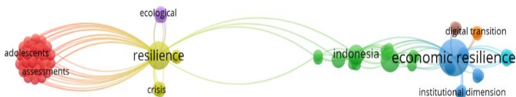
Gambar 2: Hasil VOSviewer

Pemetaan tema penelitian dimasa yang akan datang penting untuk mengembangkan penelitian yang relevan. Tema penelitian mengenai resiliensi ekonomi Islam masih sangat terbatas dan masih banyak celah penelitian yang bisa diisi. Penguatan pada fondasi pengukuran atau indeks resiliensi ekonomi perspektif Islam menjadi penting. Resiliensi ekonomi berkaitan dengan keuangan dan digitalisasi sangat dibutuhkan. Resiliensi ekonomi pasca bencana belum menunjukkan minat kearah tersebut sehingga perlu untuk diteliti pada masa yang akan datang. Gambar 1 menunjukkan pemetaan tema penelitian dimasa yang akan datang: