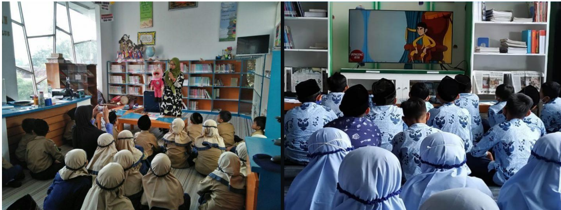
Gambar 7. Program Inovatif Perpustakaan untuk Siswa