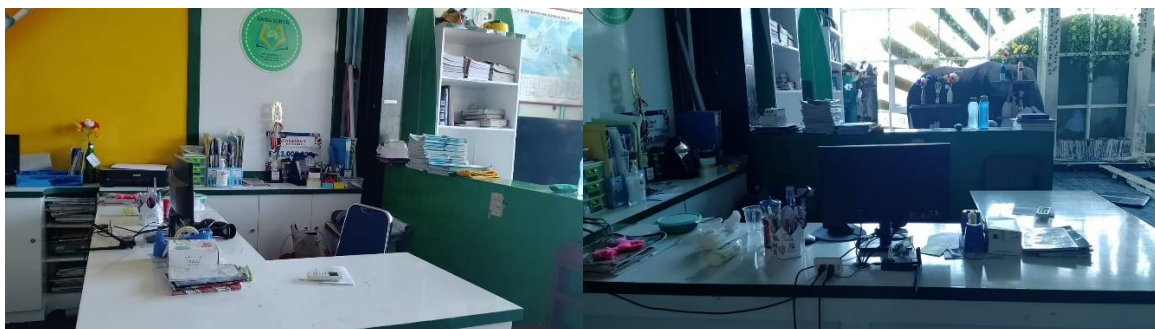
Gambar 3. Tampak Meja Layanan & Sirlulasi Perpustakaan