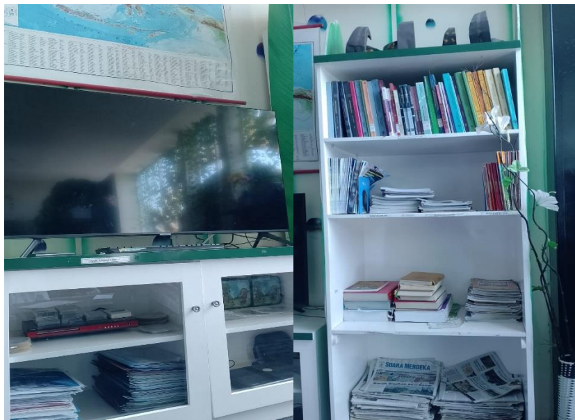
Gambar 8. Tampak Rak Audi Visual & Rak Buku Refrensi