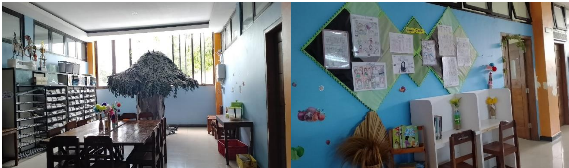
Gambar 2. Tampak Ruang Baca Luar Perpustakaan