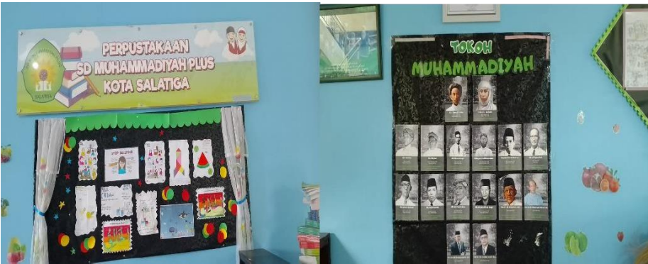
Gambar 4. Tampak Mading Karya Siswa