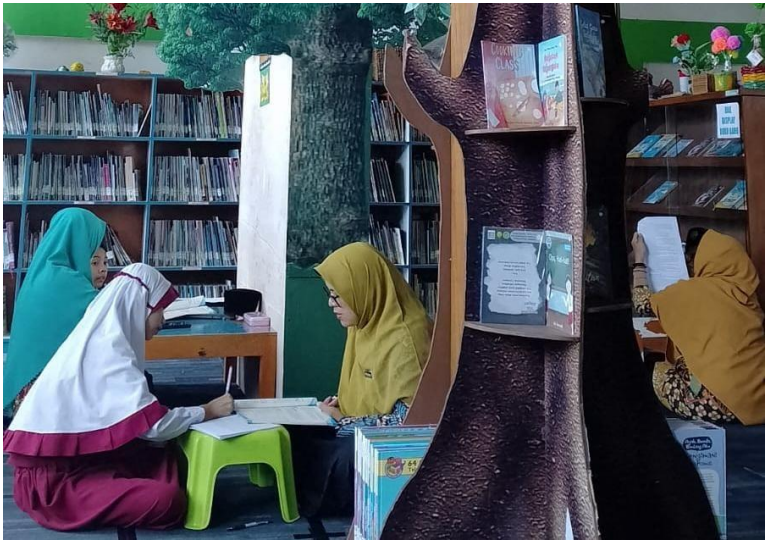
Gambar 6. Tampak Layanan Bimbingan Belajar