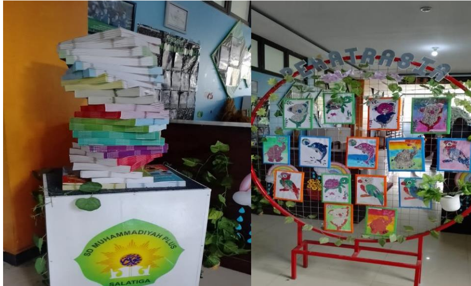
Gambar 1. Tampak Depan Perpustakaan